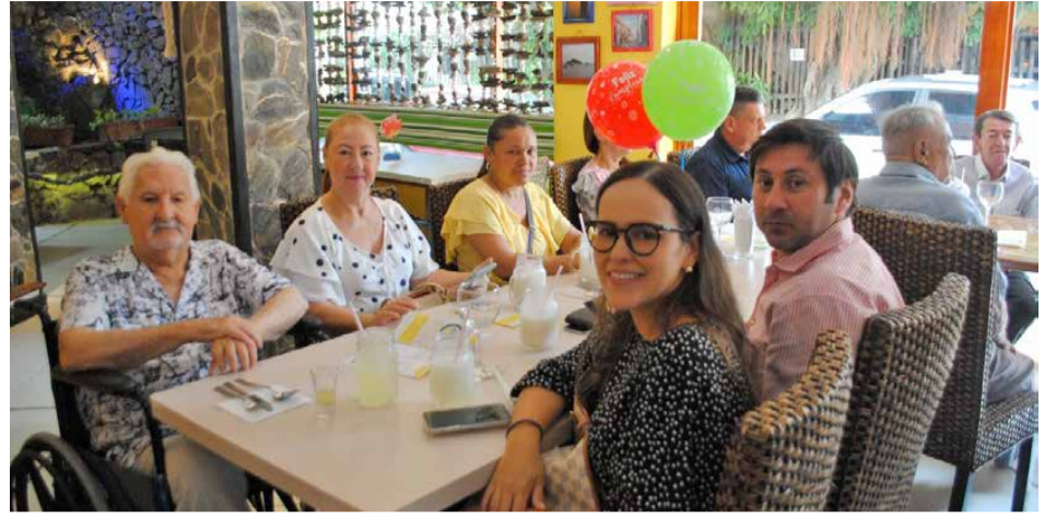
Mayor Paz Bonifacio Pallares Vanegas y familiares.