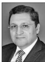
Coronel MARIO GUATIBONZA CARREÑO (*)

Hay personas que no toman en serio la principal medida que es el aislamiento y el “quedarse en casa”. Si no prevenimos con esta medida que es la única que hay por el momento, lo peor no será el virus, sino el colapso de nuestra red hospitalaria de la misma manera que ha ocurrido en otros países donde diariamente mueren más de cientos de personas a causa de este virus. ¿Si nuestra red hospitalaria que es bastante deficiente no da abasto para atender los casos del día a día, se imaginan cómo será con el aumento de contagiados?