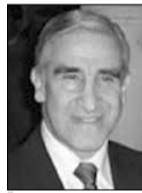
Mayor General CARLOS ALBERTO PULIDO BARRANTES

La evacuación de heridos y el rescate de personas que al internarse en las montañas para protegerse de la avalancha del río, quedaron aisladas y sin posibili-