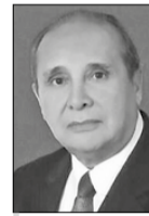
Teniente Coronel JOSÉ ALBERTO PEROZA ARTEAGA (*)

Debemos respaldar con nuestra actitud y disciplina a nuestros gobernantes y especialmente a nuestros policías que custodian las calles para prevenir el contagio y a los funcionarios de la bata blanca, que laboran en los diferentes establecimientos hospitalarios, a nivel central y regional, consultorios y dispensarios, quienes exponen su salud e integridad, y hacen hasta lo imposible por atender un pue-